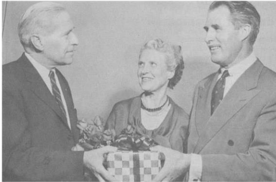
Département du transport, publication du personnel – juin-juillet 1960